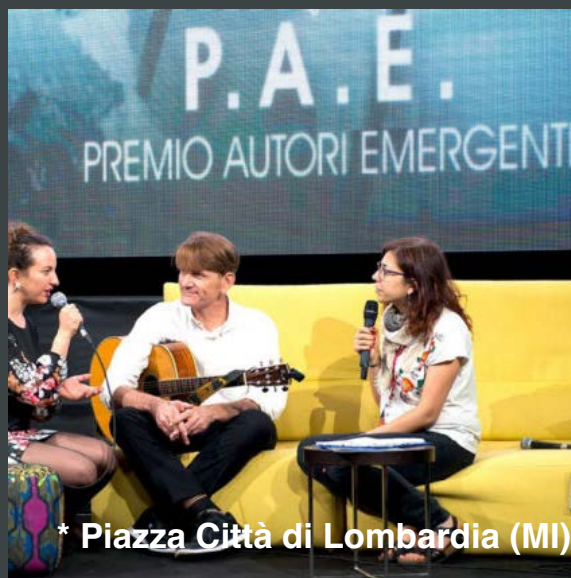
* Piazza Città di Lombardia (MI)

Il concorso è aperto agli artisti provenienti dal territorio nel quale si svolge. La partecipazione può essere con iscrizione gratuita o con tramite una quota di partecipazione. Lo scopo dell'iniziativa è rappresentato dalla volontà di sostenere, promuovere e valorizzare nuovi progetti creativi in campo musicale. PAE è alla ricerca di artisti per 3 differenti categorie: cantautori (autori cantanti), autori di canzoni e rapper/trapper. Nel 2016 il Premio Migliore Autore – Cantautore Esordiente, volto a Erba (CO) è stato assegnato a La Rappresentante di Lista, duo che ha di recente calcato il palco dell'Ariston di Sanremo con il brano "Ciao Ciao".