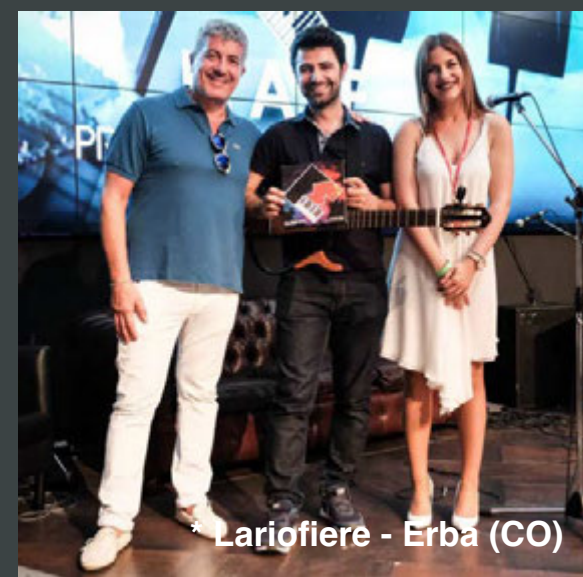
* Lariofiere - Erba (CO)